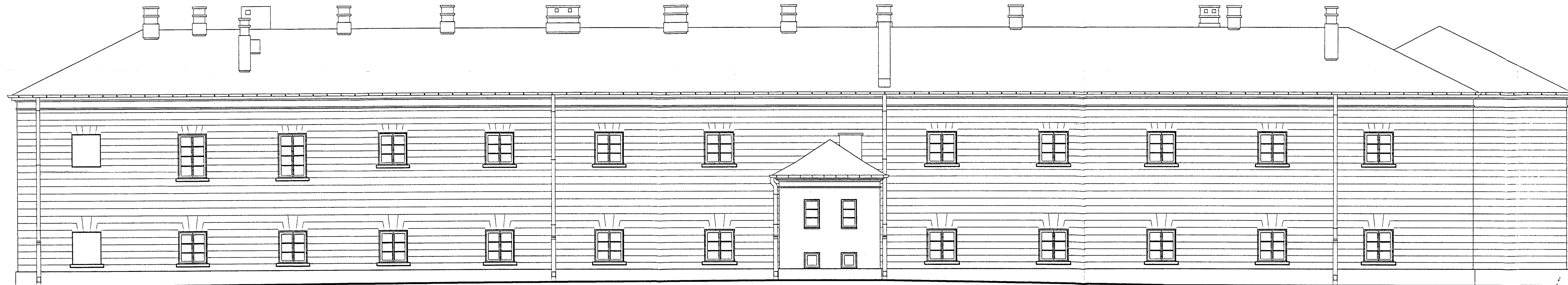
ELEWACJA WSCHODNIA SKALA 1:100